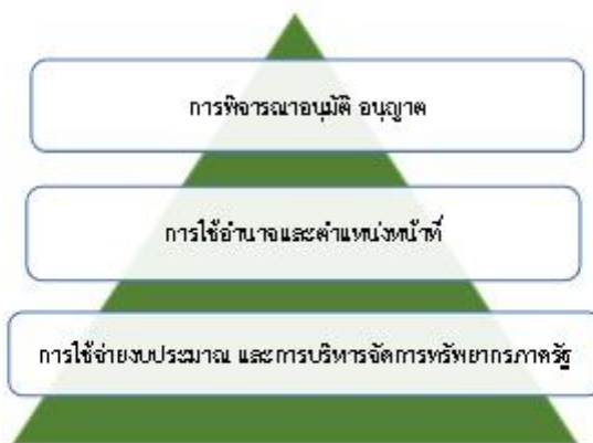
การประเมินความเสี่ยงการทุจริต